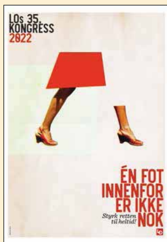
Egil Haraldsen og Ellen Lindeberg i Exil Design med sin illustrasjon av LOs kamp for heltidsstilling.