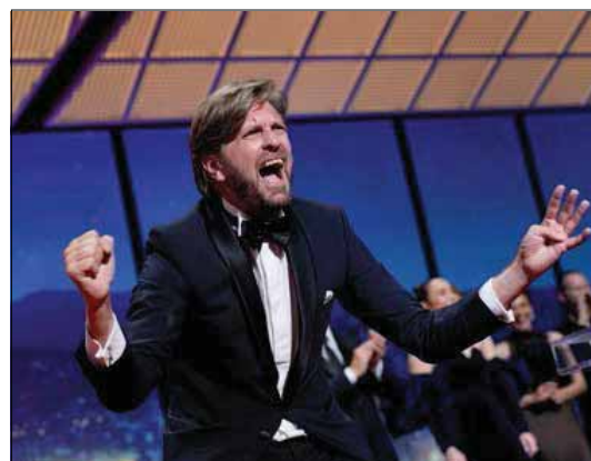
Ruben Östlund vant lørdag Gullpalmen i Cannes for andre gang. Han fikk prisen for sin film «Triangle of Sadness».