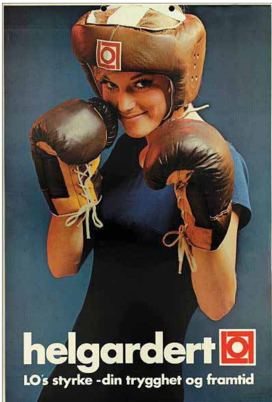
Slik så LOs plakater ut i 1968. Nå viser årets LO-kongress en utstilling med moderne politisk plakatkunst.